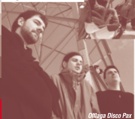
Offlaga Disco Pax