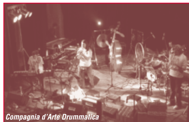
Compagnia d'Arte Drummatica

nell'altrettanto affascinante Rocca Sforzesca di Riolo Terme . Concluderà il programma, mercoledì 27 luglio a lato dello storico Pavaglione in Largo Baruzzi a Lugo, la performance di Musica incidentale della Compagnia d'Arte Drummatica di Mantova.