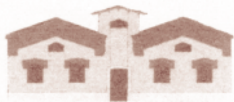
CENTRO DI RICERCA ESPRESSIVA VECCHIO MACELLO

Grazie ad una recente ristrutturazione che non ha alterato le forme originarie, il centro è tornato a piena vita insieme ad un progetto ambizioso e stimolante: offrire ai giovani uno spazio interamente dedicato alla danza e alla musica. Un luogo per nutrire passioni e creatività. Inaugurato il 15 settembre 2001, lo stabile è rinato con una nuova veste e un nome programmatico: Centro di Ricerca Espressiva Vecchio Macello . Attualmente, l'edificio ospita le aule della scuola